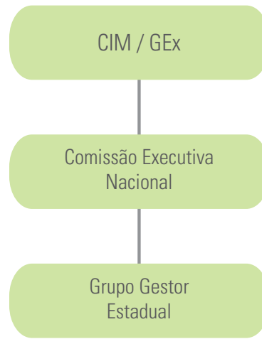
Modelo de Governança do Plano ABC